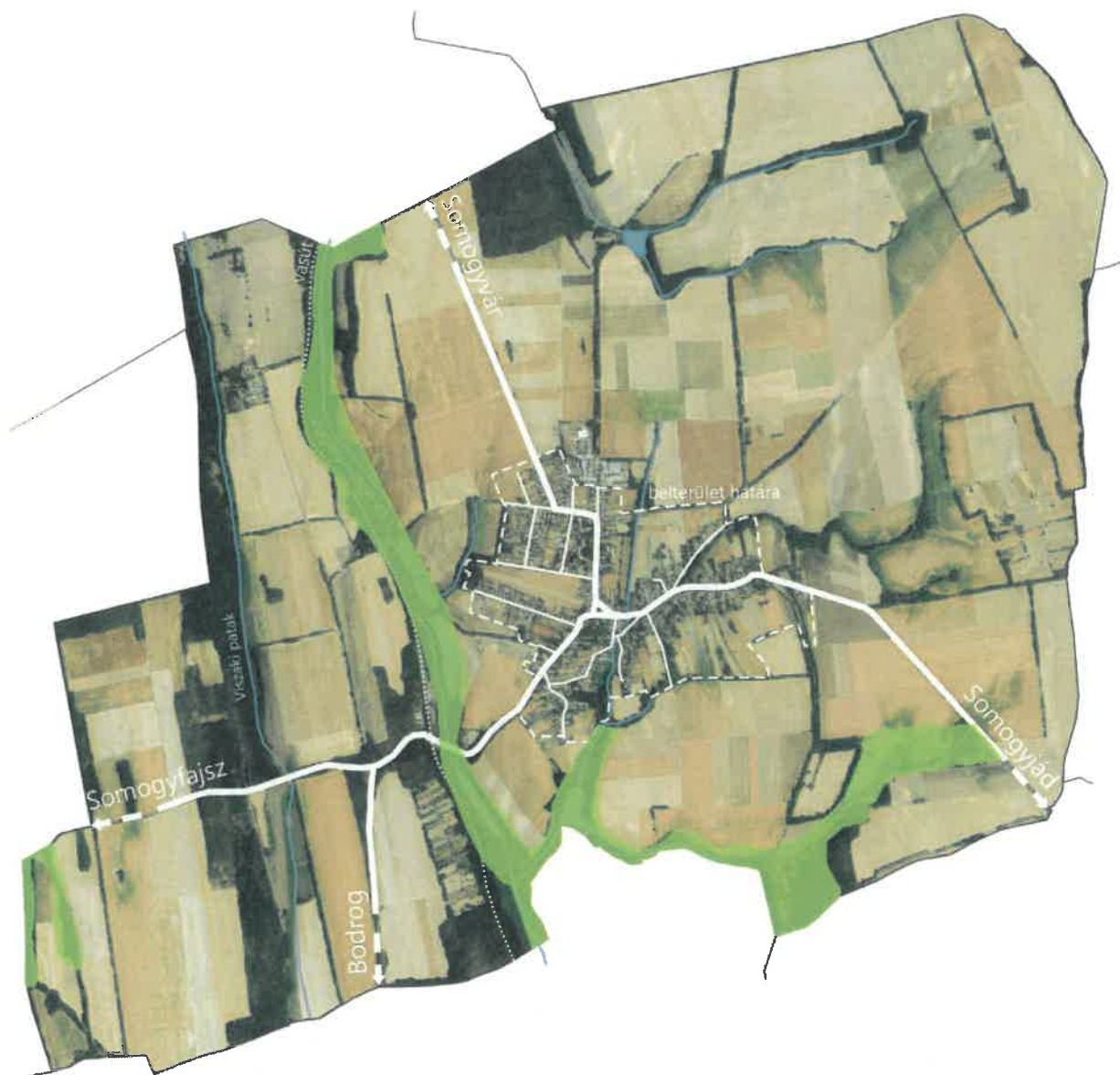
Országos Ökológiai Hálózat területe